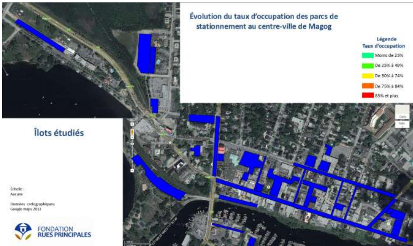
Carte du territoire à l'étude

Le territoire à l'étude se situe au centre-ville de Magog et il a été divisé en 34 îlots différentes pour les fins d'analyses. Ces stationnements sont utilisés en majorité par des usagers ayant deux destinations de prédilection soit le centre-ville ou le lac Memphrémagog. La dénomination des îlots est fournie dans la section de l'offre réelle de la section trois du rapport.